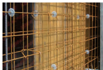
POLIETILENE HD GRIGIO conf. 1000 PZ

I vantaggi della nuova serie PAV sono i seguenti: 1° UNICO DISTANZIATORE UNIVERSALE PER FERRI da 4 a 12 mm. 2° FACILITÀ D'INSERIMENTO. 3° DESIGN INNOVATIVO E TECNICO.