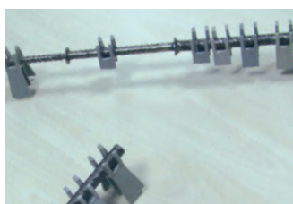
POLIETILENE HD GRIGIO conf. 3000 PZ