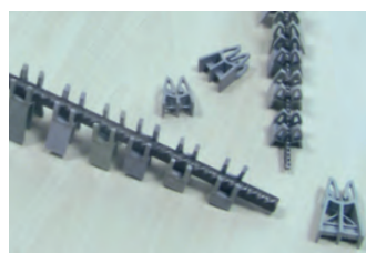
POLIETILENE HD GRIGIO conf. 3000 PZ

I vantaggi della nuova serie PAU sono i seguenti: 1° UNICO DISTANZIATORE UNIVERSALE PER FERRI da 4 a 12 mm. 2° FACILITÀ D'INSERIMENTO. 3° ROBUSTO E RESISTENTE SOSTIENE CARICHI ELEVATI.