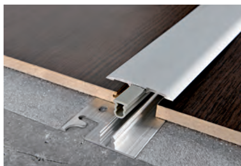
TOP ALL. + INSERTO PIN + BASE 45 ALL. TRINCIATA/FORATA (6 finiture all. anod. di cui 3 a richiesta) thermo packed lung. barre 2,7 ML - conf. 20 PZ - 54 ML (H 17 - 19mm - 40,5 ML)

TOP + INSERTO PIN + BASE IN ALLUMINIO 30 FINITURE LEGNO E 6 FINITURE ANODIZZATE