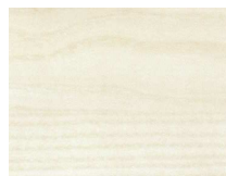
Forte 313 Futura disegno