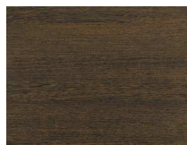
Forte 234 Wengè plancia