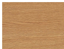
Forte 330 Rovere Land plancia