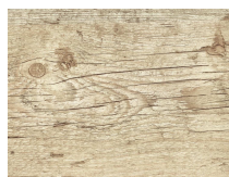
Forte 122 Pino Rustico plancia