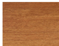
Forte 334 Doussié plancia