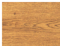
Forte 208 Rovere Hemingway plancia