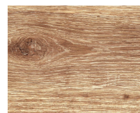
Forte 181 Rovere di Francia plancia