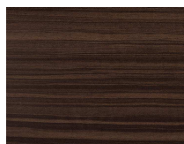
Forte 151 Palissandro moka plancia