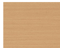
Forte 356 Faggio plancia