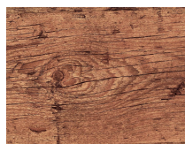
Forte 146 Cedro antico plancia