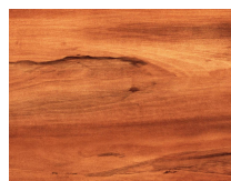
Forte 148 Pimentero plancia