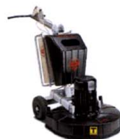
MOLATRICE HTC 800