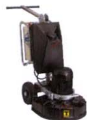
MOLATRICE HTC 500