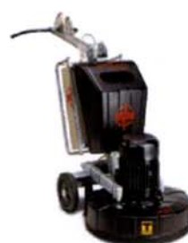
MOLATRICE HTC 650