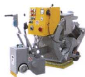
PALLINATRICE T30 SM