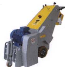
SCARIFICATRICE TR300 I/4