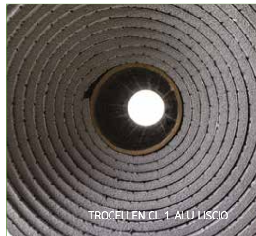
TROCELLEN CL 1 ALU LISCIO

Euroclass B-s2,d0 per spessori 3-10 mm; Euroclass C-s2,d0 per spessore 12 mm, adesivo, a norma EN 13501-1, verde chiaro