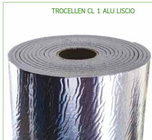
TROCELLEN CL 1 ALU LISCIO